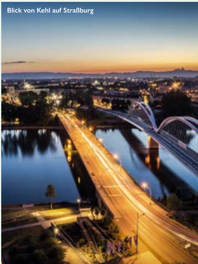
Blick von Kehl auf Straßburg

** In den Juniorsuiten der Kategorien 4 und 6 können Schiffsgeräusche auftreten.