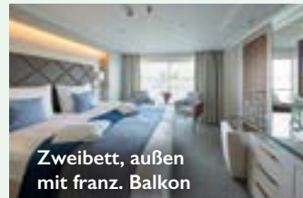
Zweibett, außen mit franz. Balkon