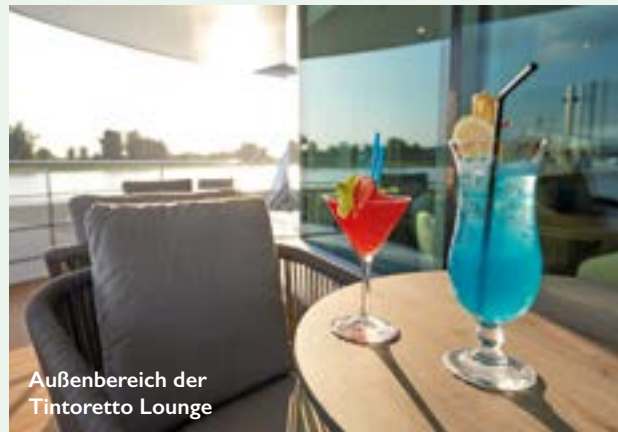
Außenbereich der Tintoretto Lounge