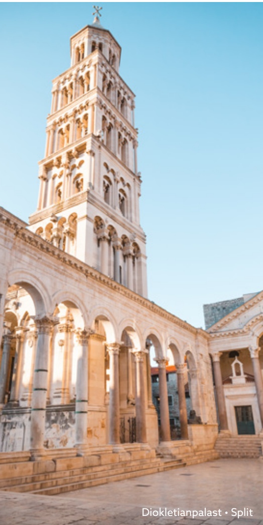
Diokletianpalast • Split