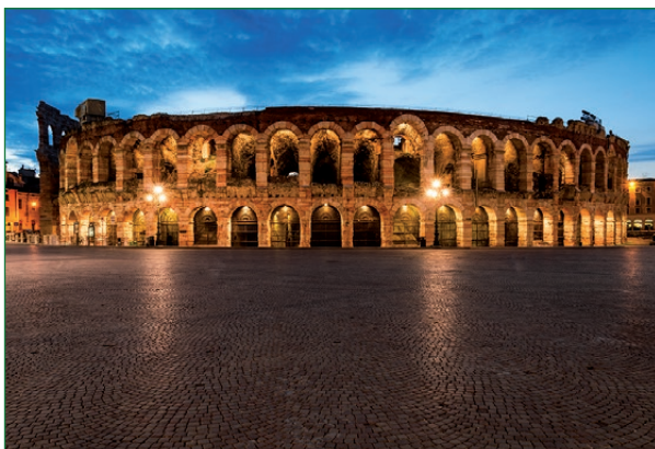
Die Arena di Verona verspricht eine hervorragende Akustik für ein unvergessliches Musikerlebnis.