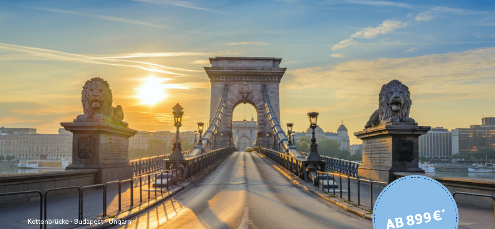
Kettenbrücke · Budapest · Ungarn