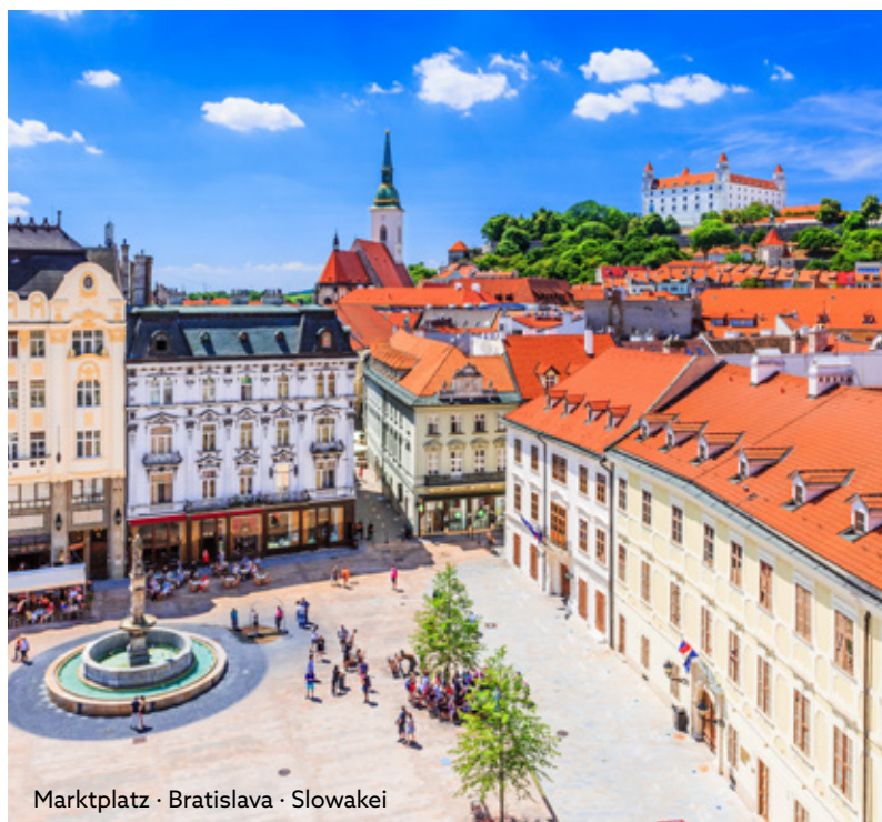
Marktplatz · Bratislava · Slowakei