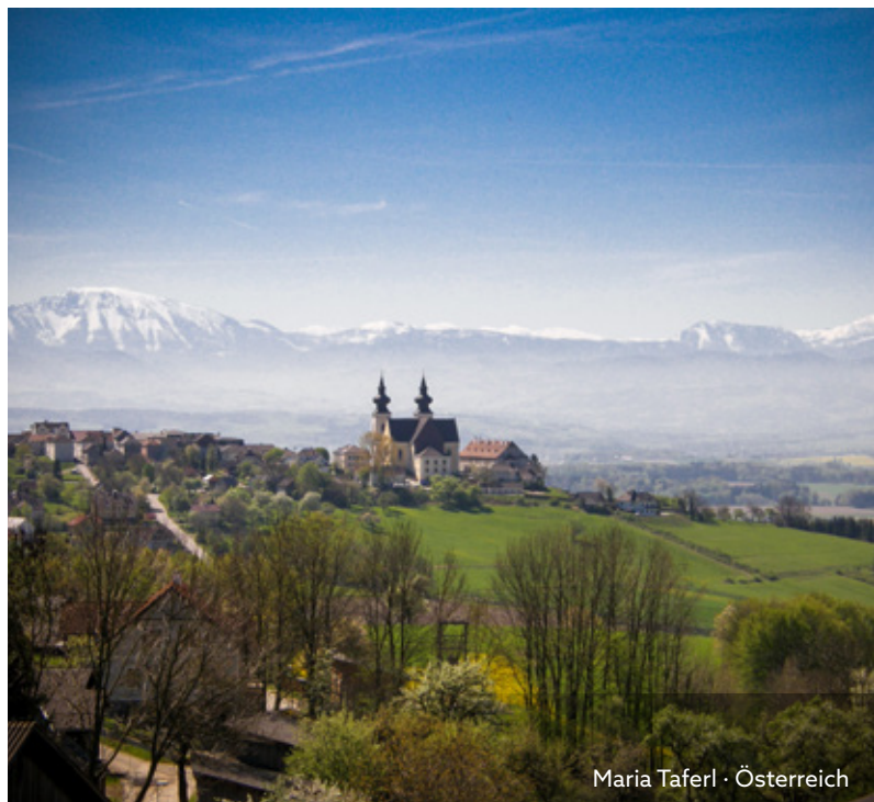
Maria Taferl • Österreich

Hoch über dem Donautal liegt Maria Taferl – genießen Sie eine unvergleichliche Aussicht auf die Alpenkette