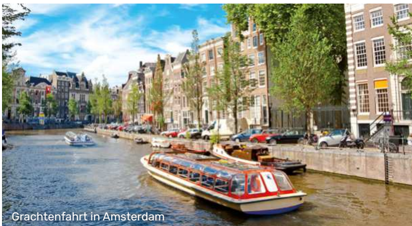
Grachtenfahrt in Amsterdam

Alle Zeiten sind Richtzeiten. Programmänderungen, auch durch Hoch- oder Niedrigwasser, oder Verzögerungen bei Schleusendurchfahrten sind vorbehalten.